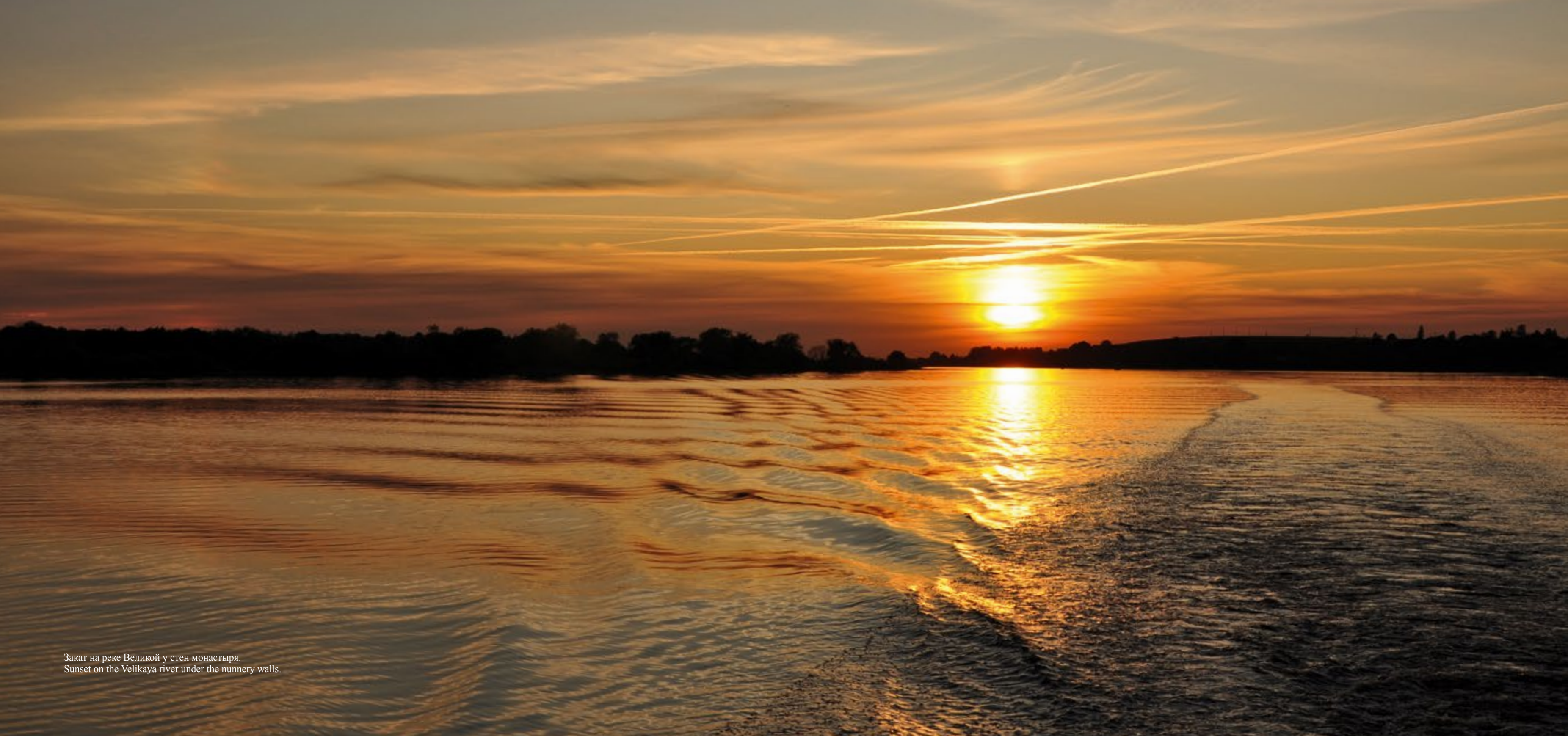
Закат на реке Великой у стен монастыря. Sunset on the Velikaya river under the nunnery walls.