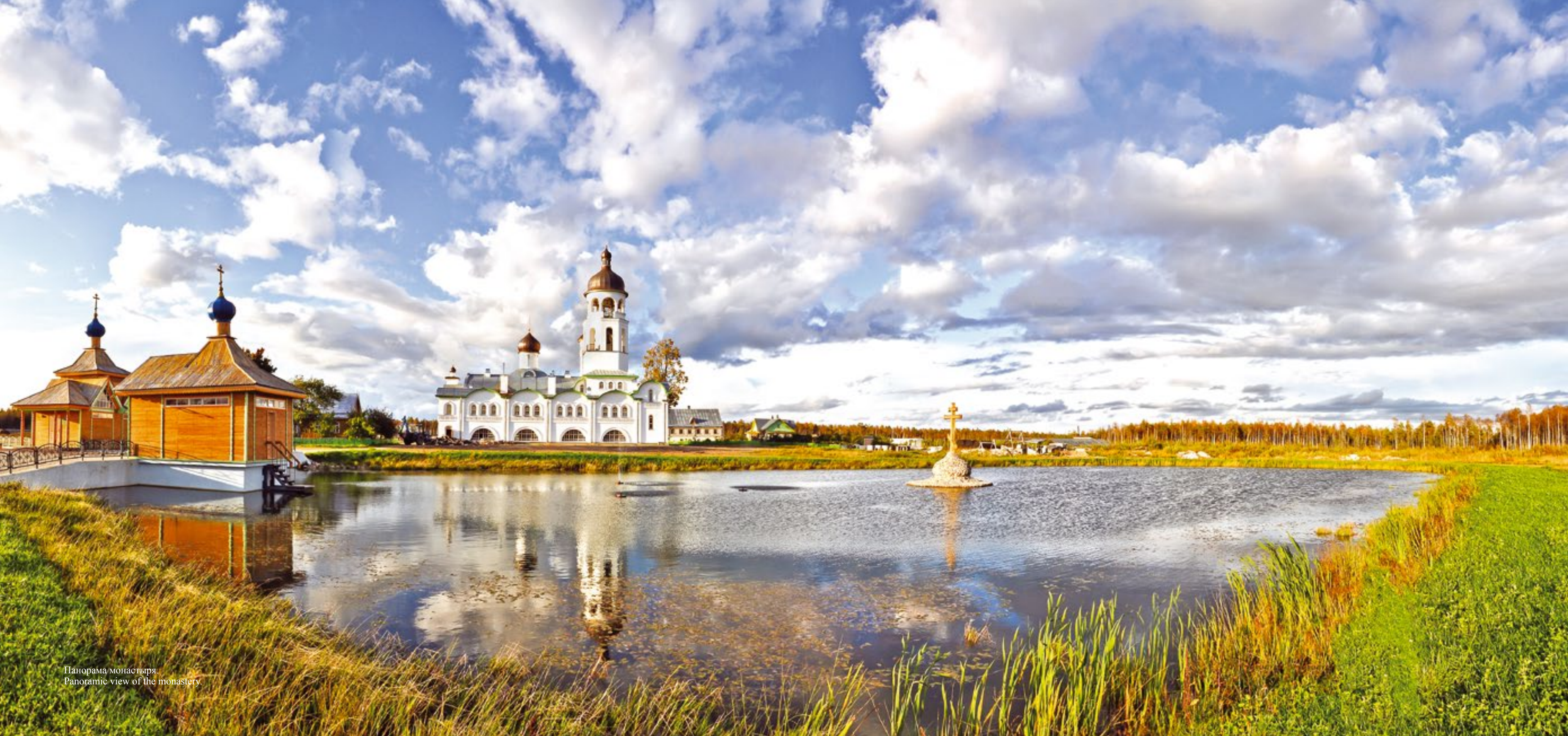
Панорама монастыря. Panoramic view of the monastery.