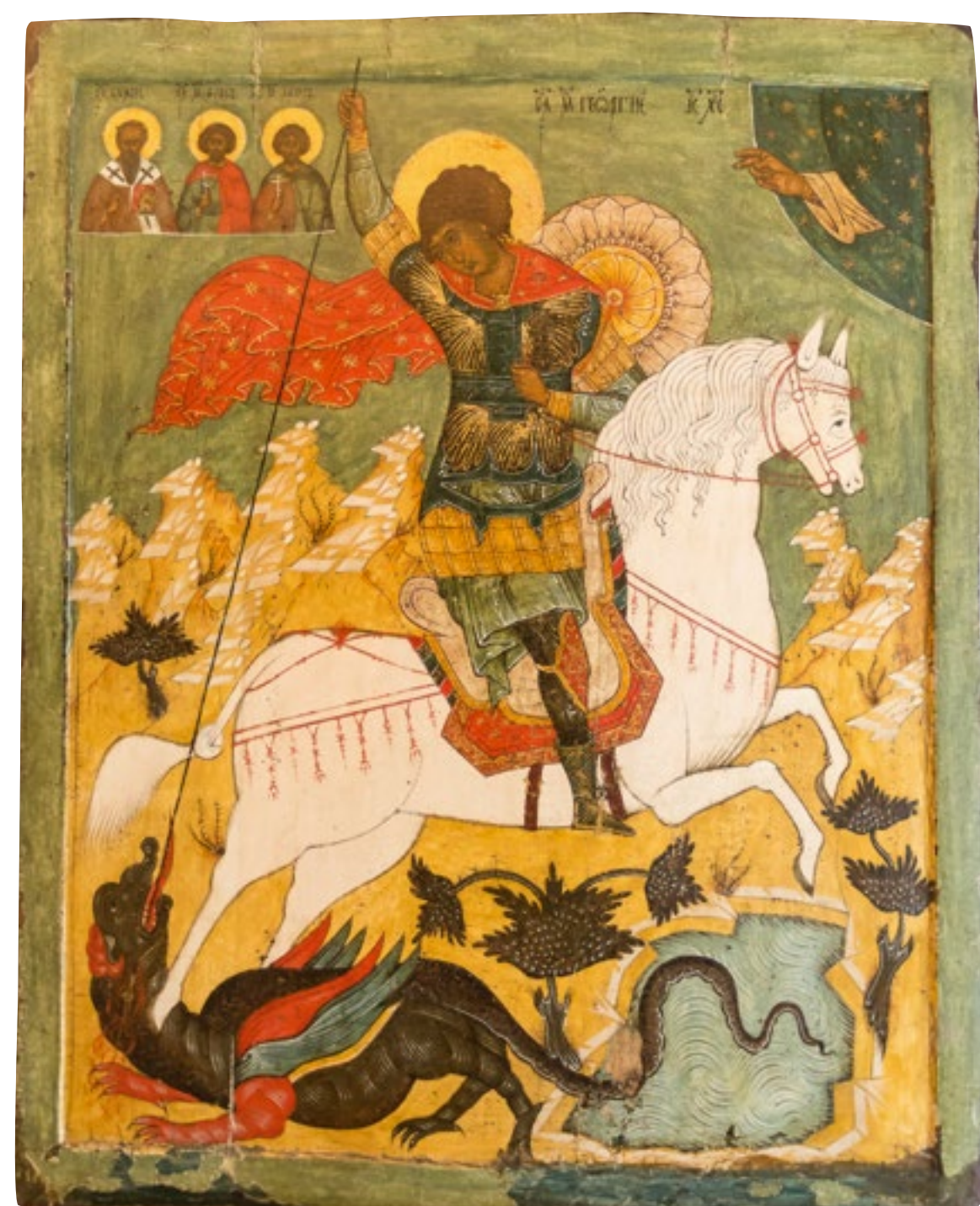
Икона «Чудо Георгия о Змие», 16 век. Icon of "The Miracle of St George and the Dragon", C 16th.