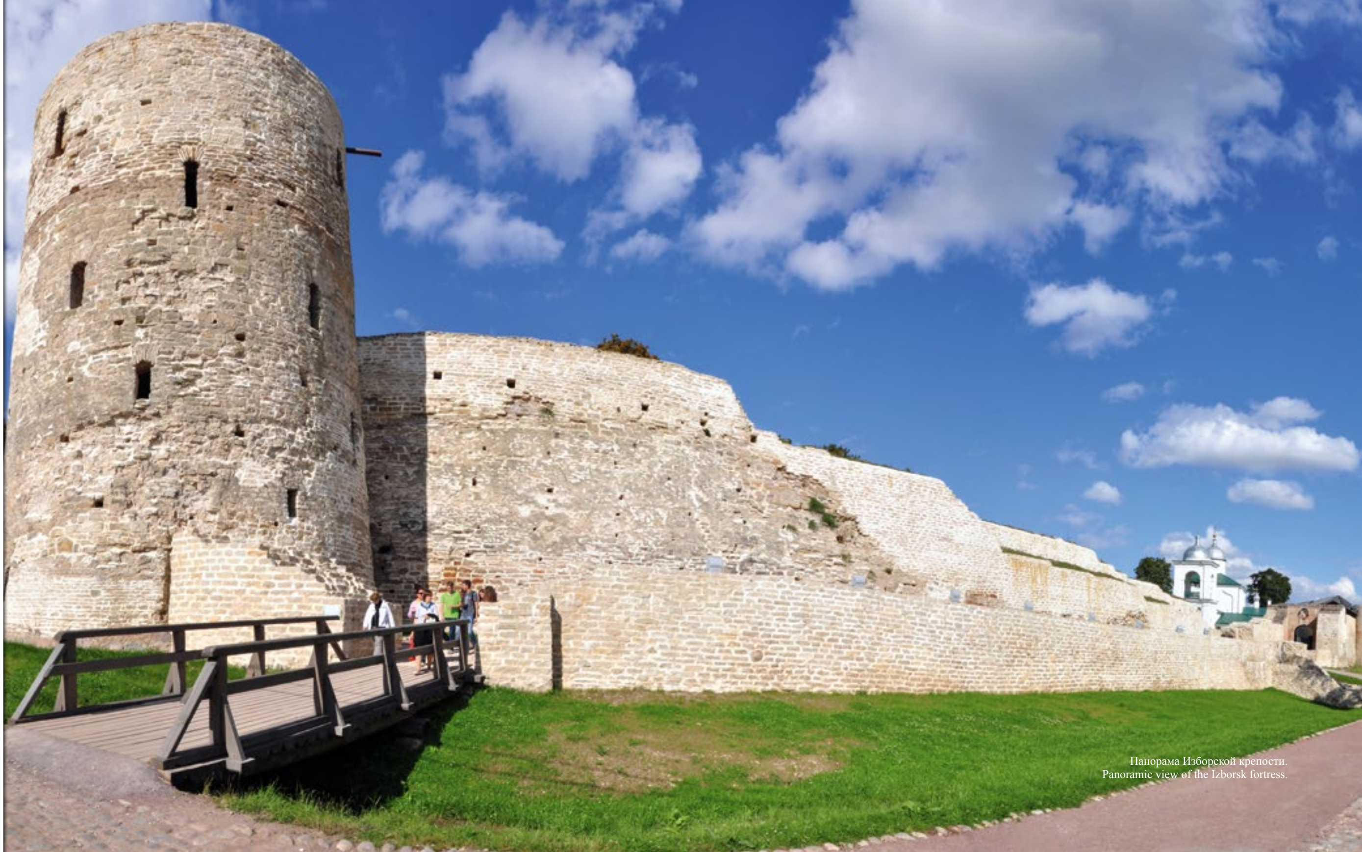
Панорама Изборской крепости. Panoramic view of the Izborsk fortress.