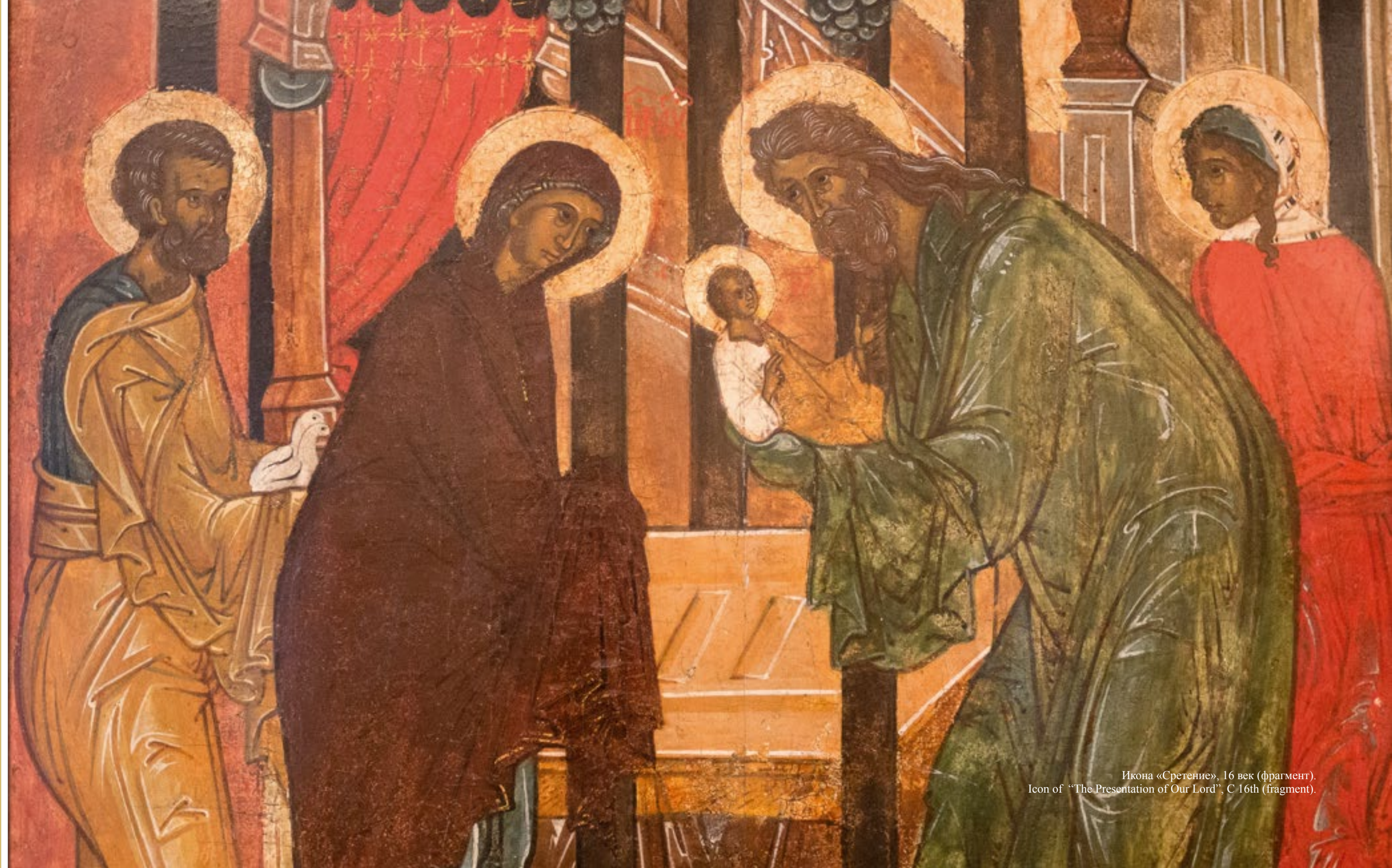
Икона «Сретение», 16 век (фрагмент). Icon of "The Presentation of Our Lord", c. 16th (fragment).