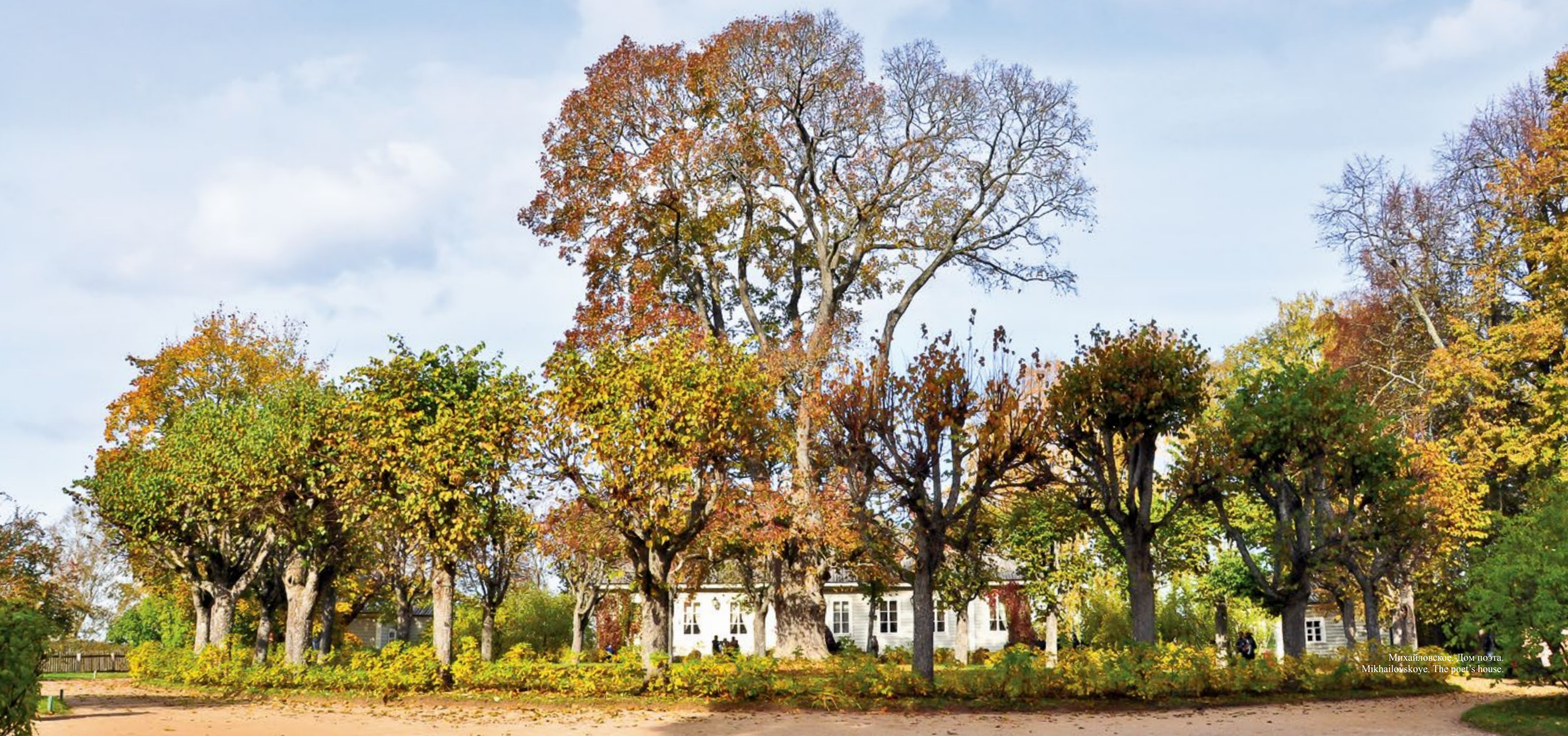
Михайловское. Дом поэта. Mikhailovskoye. The poet's house.