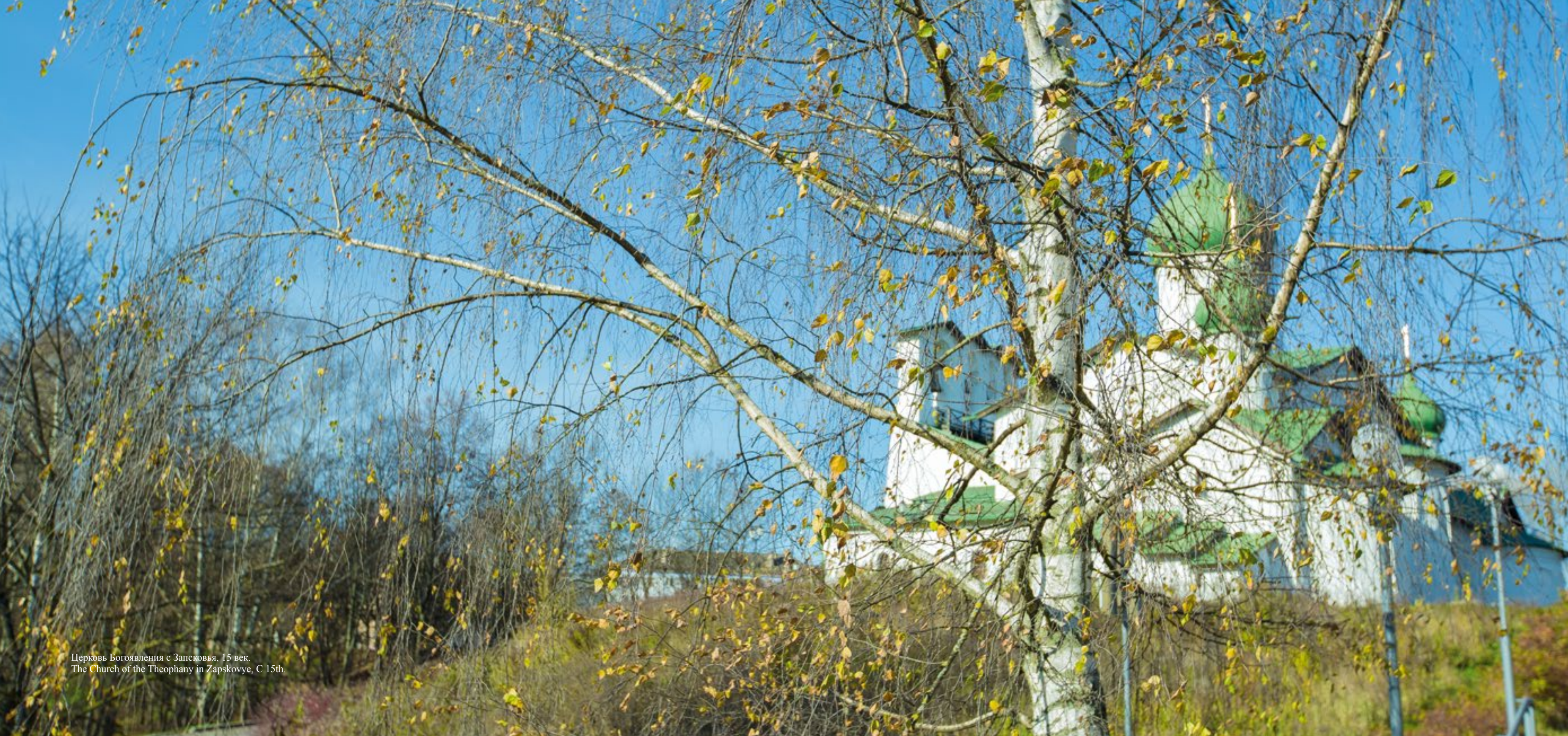
Церковь Богоявления с Запсковья, 15 век. The Church of the Theophany in Zapkovye, C 15th.