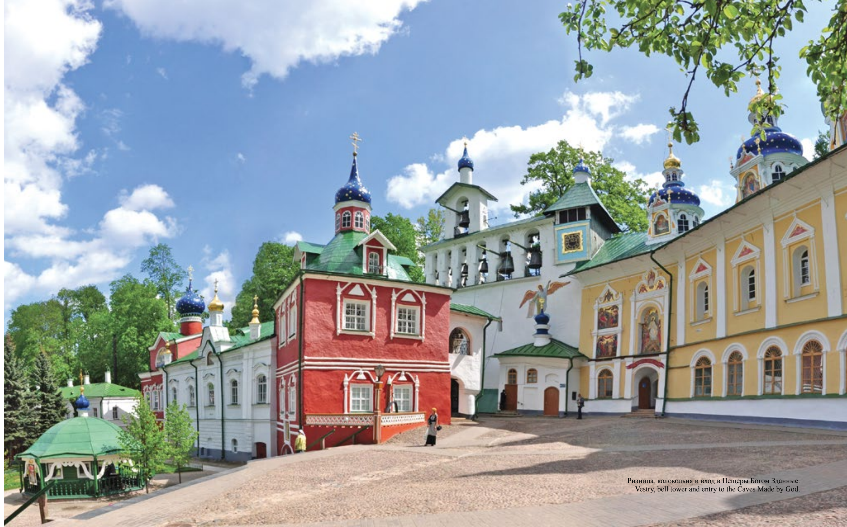
Ризница, колокольня и вход в Пещеры Богом Зданные. Vestry, bell tower and entry to the Caves Made by God.