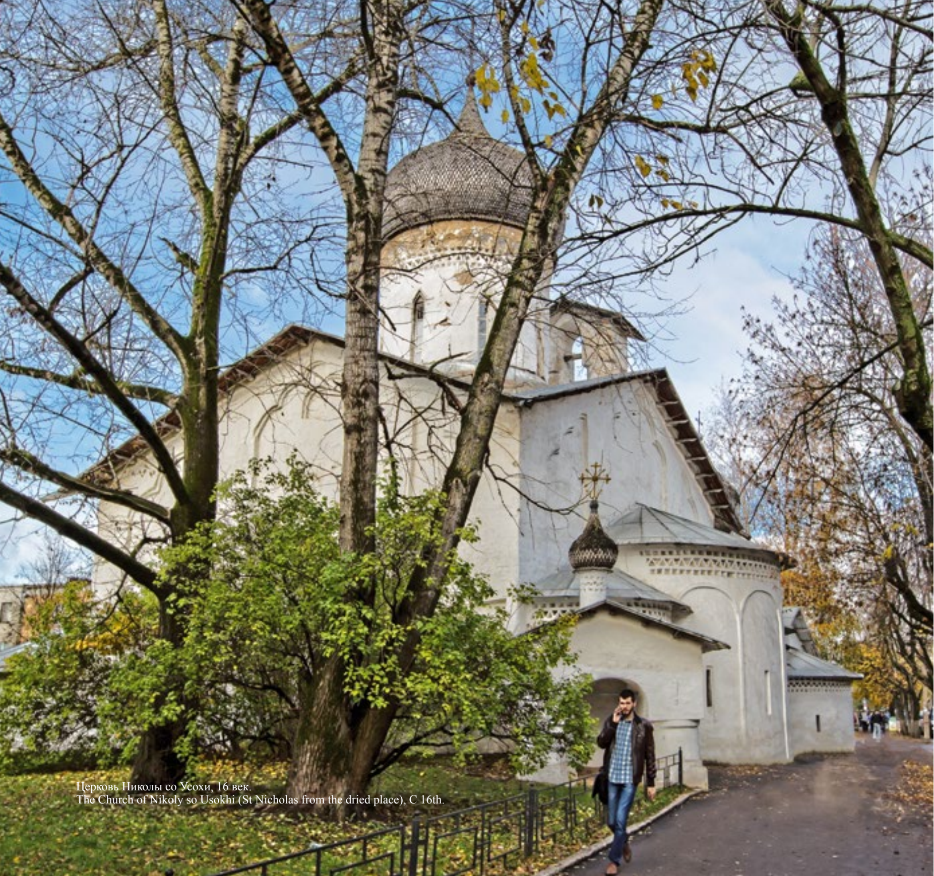
Церковь Николая со Усохи, 16 век. The Church of Nikolay so Usokhi (St Nicholas from the dried place), C 16th.

«Да у вас тут ангелы летают!» – приезжающие в Псков паломники не в силах скрыть свои радостные эмоции. В самом деле, православный человек, идя по Пскову, не успевает креститься, встречая на своём пути храм за храмом.