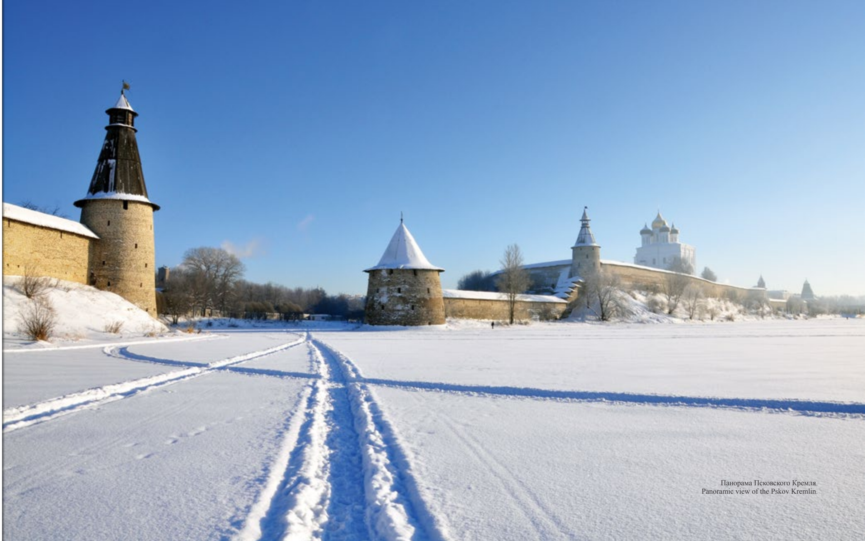
Панорама Псковского Кремля. Panoramic view of the Pskov Kremlin.