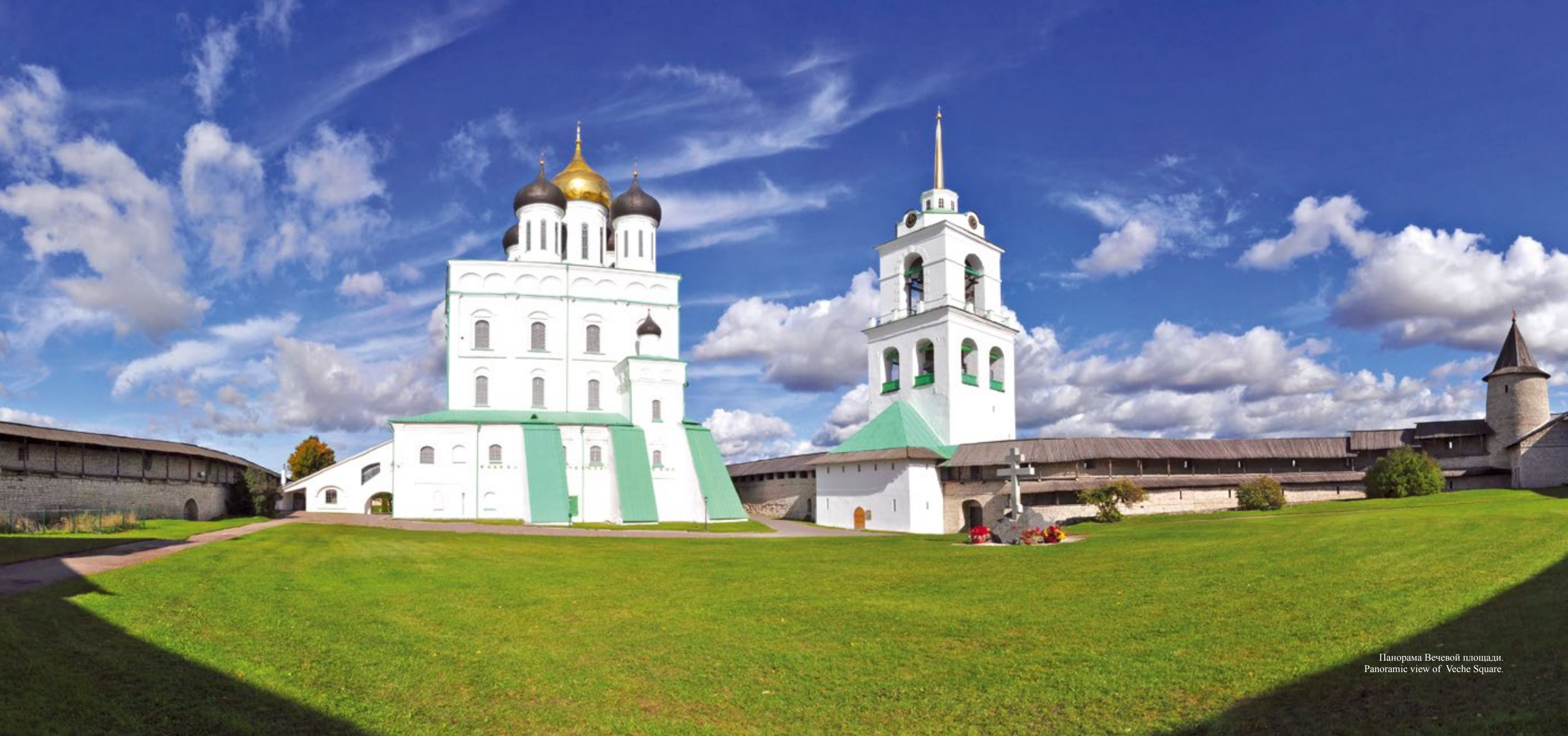
Панорама Вечевой площади. Panoramic view of Veche Square.