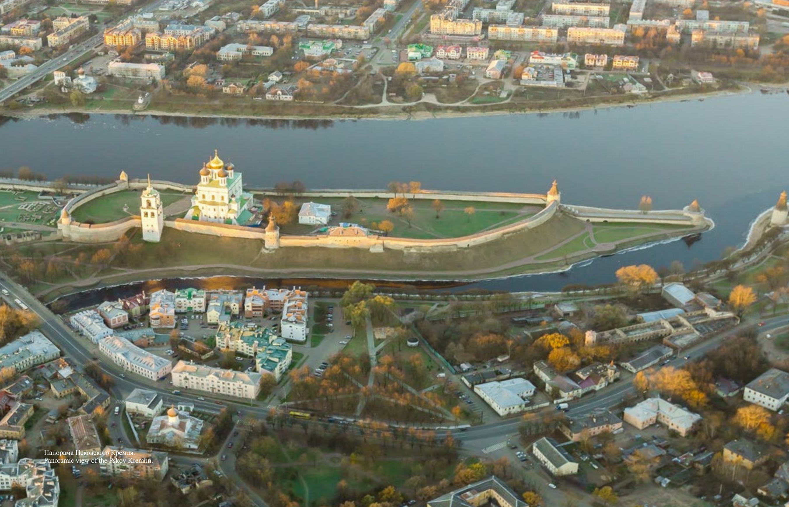
Панорама Псковского Кремля. Panoramic view of the Pskov Kremlin.

История древнего Пскова начинается на высоком скалистом мысе у слияния рек Великая и Пскова. Современные археологические исследования свидетельствуют о том, что уже более трёх тысяч лет назад селились здесь люди, а уже в 7 веке наши далёкие предки славяне-кривичи приступили к обустройству Детинца – Крома, ставшего центром будущего города.