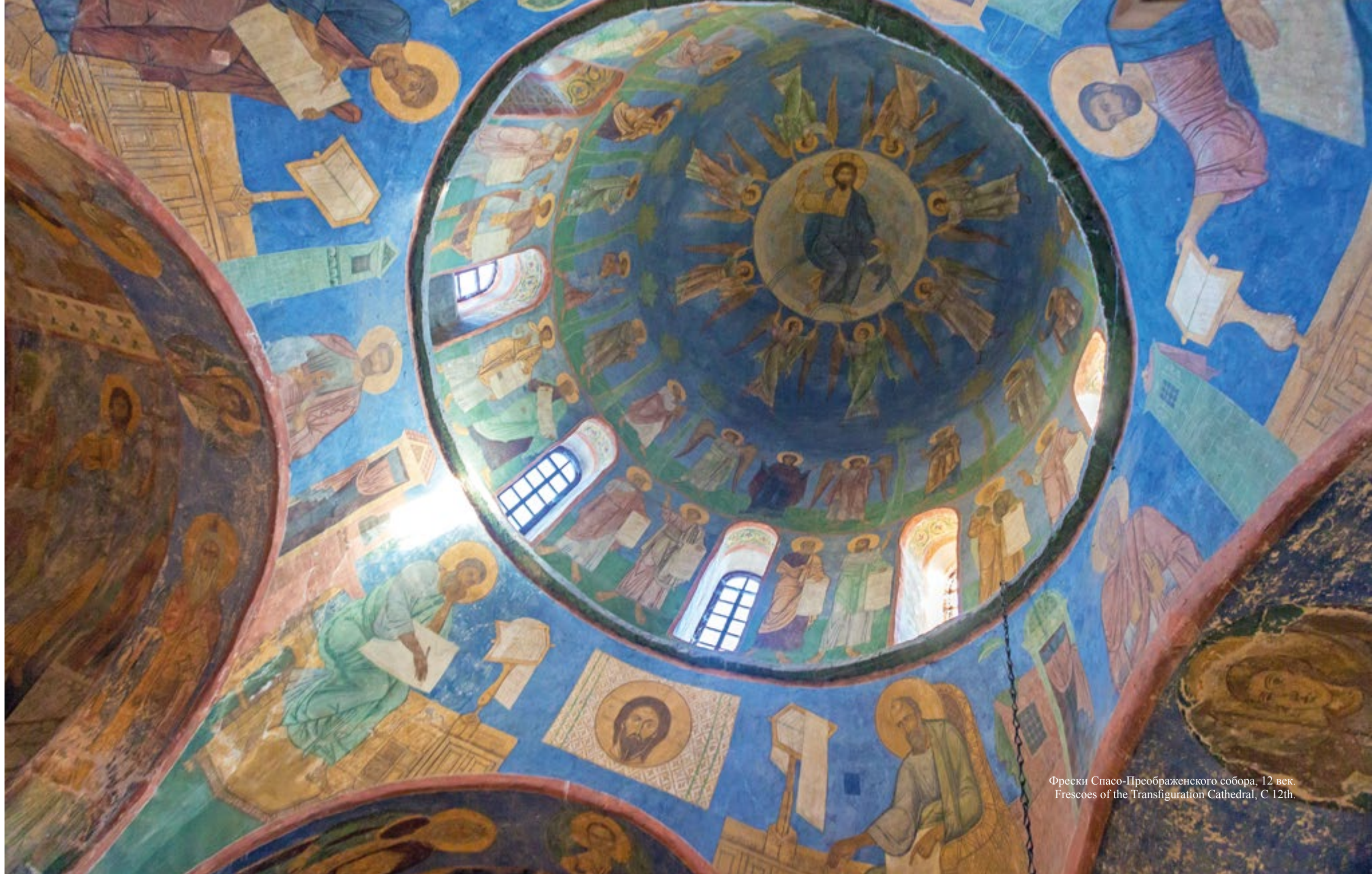
Фрески Спасо-Преображенского собора, 12 век. Frescoes of the Transfiguration Cathedral, C 12th.

Спасо-Преображенский собор стал первым каменным храмом древнего Пскова. Работы по его возведению и созданию фресок велись почти одновременно. Несомненно, что в строительстве