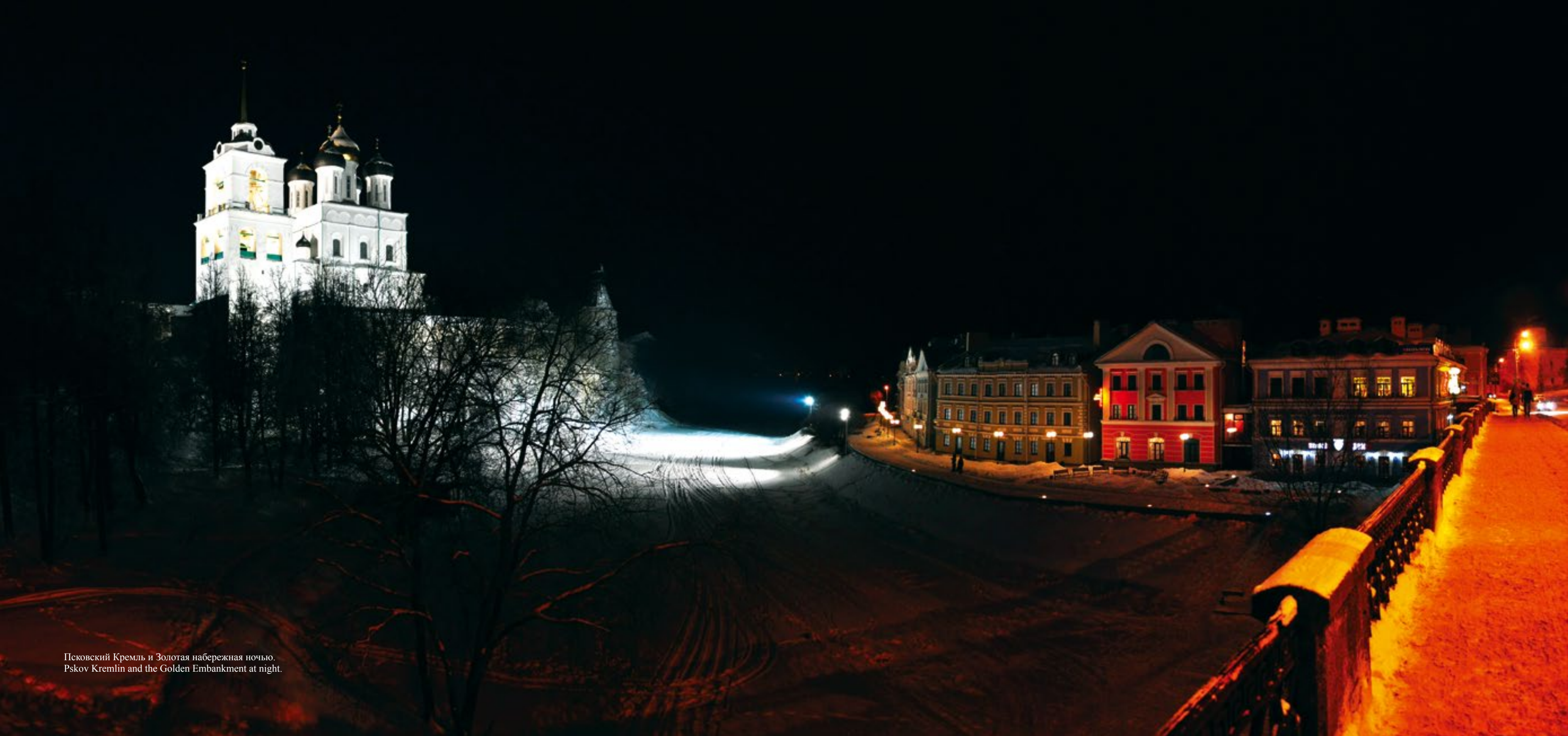
Псковский Кремль и Золотая набережная ночью. Pskov Kremlin and the Golden Embankment at night.