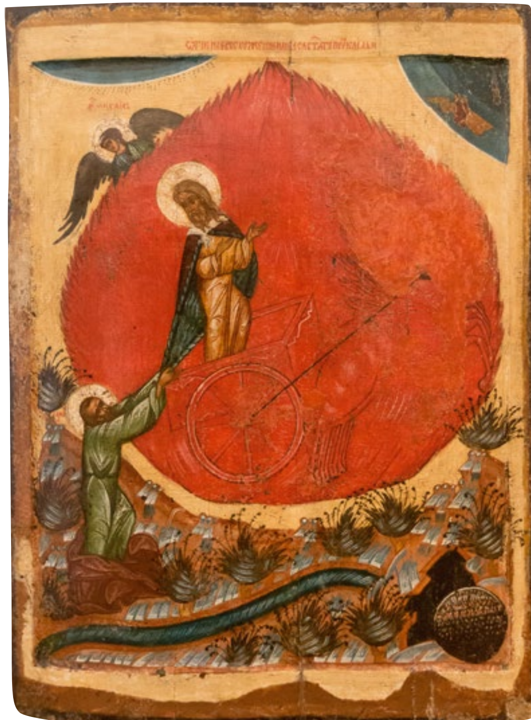
Икона «Огненное восхождение пророка Ильи», 16 век. Icon of "Elijah the Prophet's Fiery Ascent", C 16th.