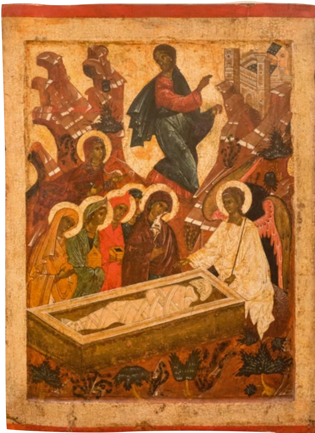
Икона «Жёны-Мироносицы у гроба Господня», 16 век. Icon of "The Myrrh-Bearing Women at the Holy Sepulcher", C 16th.