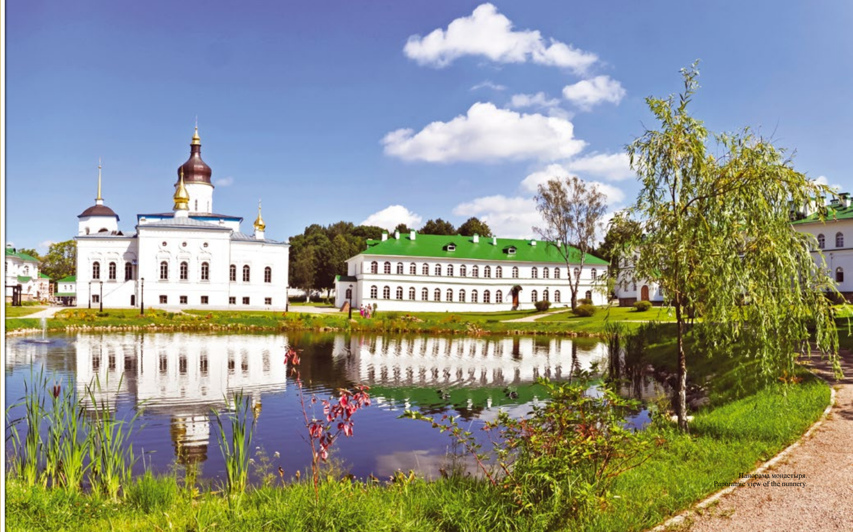
Панорама монастыря. Panoramic view of the nunnery.