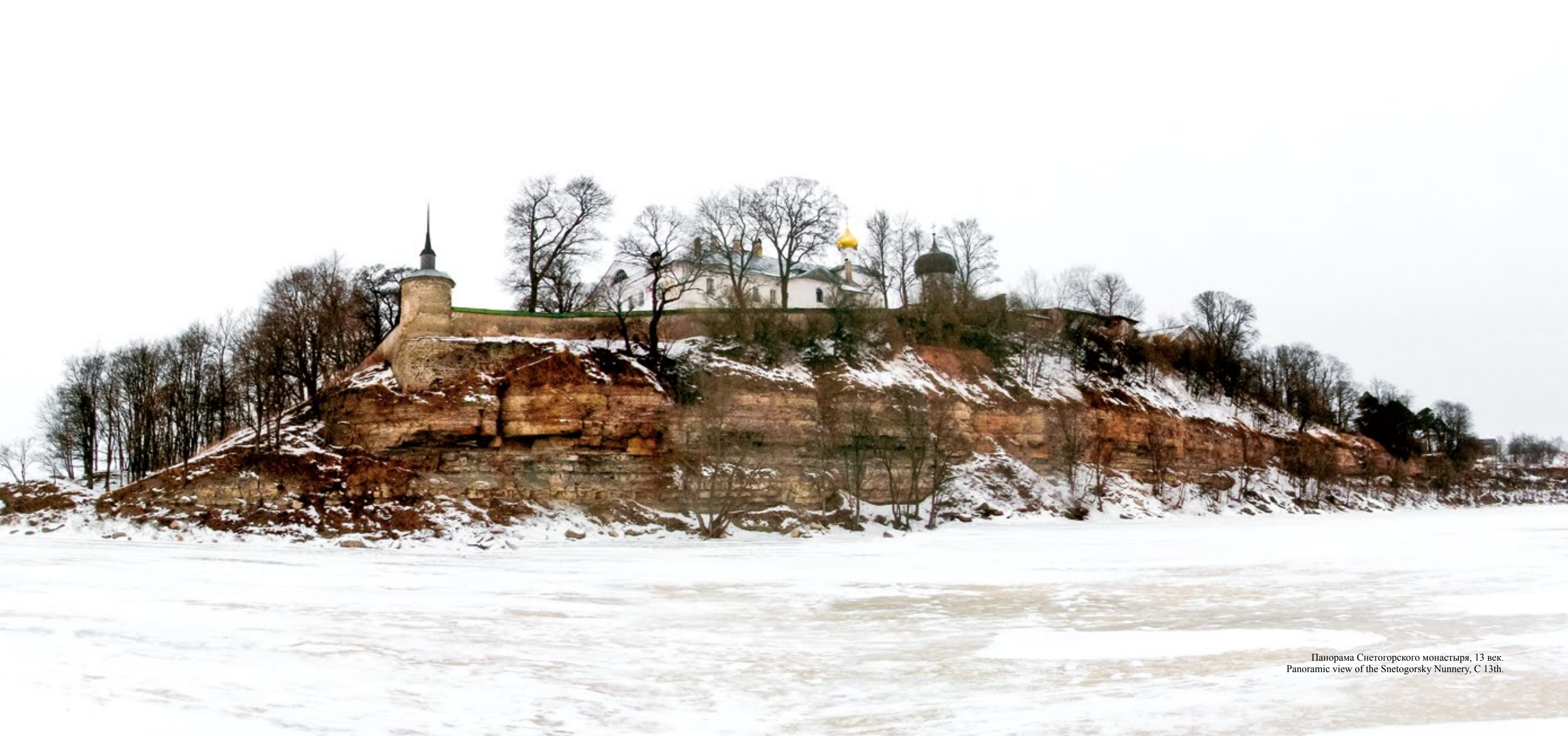
Панорама Снеготорского монастыря, 13 век. Panoramic view of the Snetogorsky Nunnery, C 13th.