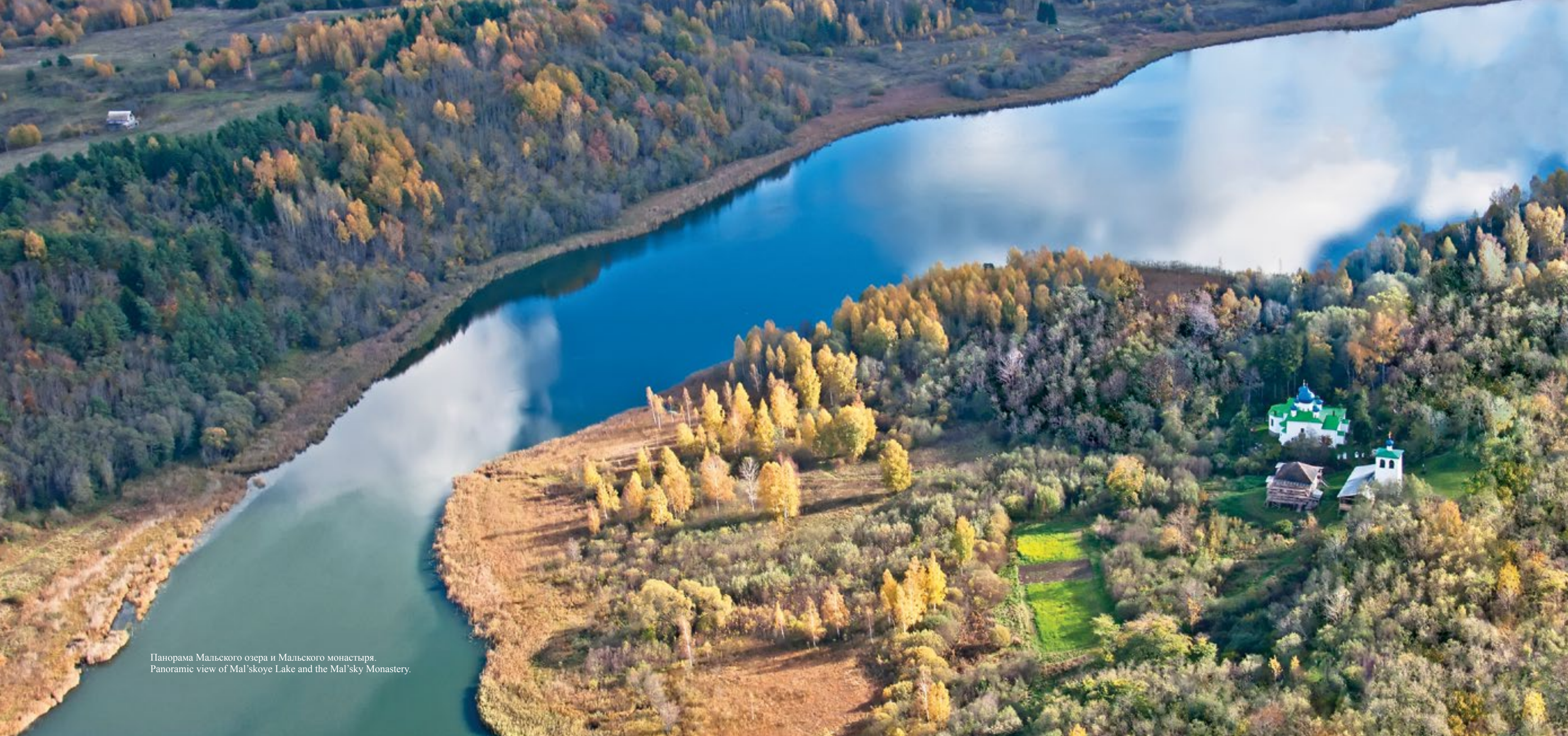
Панорама Мальского озера и Мальского монастыря. Panoramic view of Mal'skoye Lake and the Mal'sky Monastery.